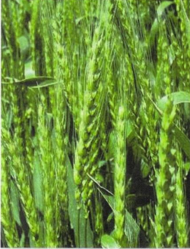
WHEAT: before it is fully ripe.